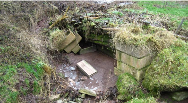
Schlammfang vor Hettstedt; Foto: J. Köhn [02/2015]

Durch die Veränderung des Klimas, insbesondere der Gefahr erhöhter Niederschlagsintensitäten, aber auch durch strukturelle und politische Änderungen, müssen sich die Kommunen immer neuen Herausforderungen stellen. Kommunale Klimaanpassung wird hierbei oft als wichtiges, jedoch häufig noch nicht ausreichend berücksichtigtes Thema angesehen.