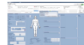
3) Telemedizinische Dokumentation